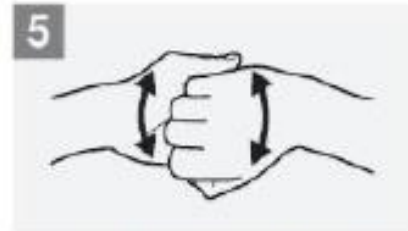
Backs of fingers to opposing palms with fingers interlocked; ظهر الأصابع يباطن اليد الأخرى مع تداخل الأصابع والحركة