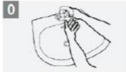
Wet hands with water; يبلل يديك بالماء

اغسل يديك بالماء و الصابون لمدة 40 - 60 ثانية عندما يكونا متسخين ظاهريا ما عدا ذلك إذ لكهما بالكحول