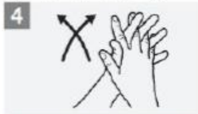
Palm to palm with fingers interlaced; باطن اليدين مع بعضهما مع تداخل الأصابع