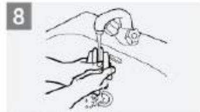
Rinse hands with water; اشطف يديك بالماء