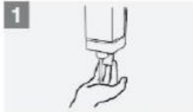
Apply enough soap to cover all hand surfaces; ضع صابون كافي لتغطية اليدين