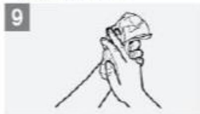
Dry hands thoroughly with a single use towel; جفف يديك بمناديل ورقية أحادية الاستخدام