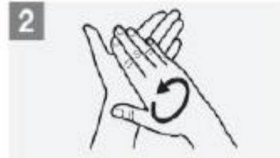
Rub hands palm to palm; إدلك باطن اليدين معا