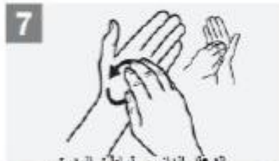
الدعك الدائري لباطن اليدين Rotational rubbing, backwards and forwards with clasped fingers of right hand in left palm and vice versa;