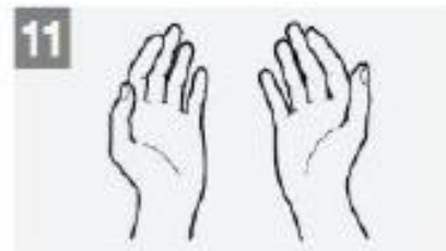
Your hands are now safe. يديك الآن آمنتين