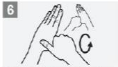
Rotational rubbing of left thumb clasped in right palm and vice versa; الدعك الدائري للإبهامين