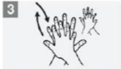
Right palm over left dorsum with interlaced fingers and vice versa; باطن اليد اليمنى على ظهر اليسرى مع تداخل الأصابع والعكس